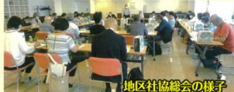
地区社協総会の様子

自然に癒される上笹下の地域は昭和40年代から順次宅地開発が進められ、その結果今では磯子区内で住民の高齢化率上位にあります。各自治町内会では高齢者の見守り活動やふれあい昼食会に各種サロン事業等「スイッチON磯子」の活動を、20年近く継続して取組んできており、更に連合自治町内会・地区社協・各福祉系団体等のメンバーで連携して、住民相互の顔の見える関係づくりや高齢者の孤立化を防ぐ地道な活動も進めてきました。私ども地区社協は福祉全般を取組んでいます。特に高齢者問題が優先されますが、次代を担う子供達の見守り活動、「子育てひろばにこにこ」や今年から「こども食堂」の支援等事業の枠を拡げています。また、地域の情報を共有化し、上笹下地区の住民の方々の楽しい相互の交流を図るために、「広報紙」の掲載内容の充実を目指し、従来の取材対象範囲を社協以外にも拡げ、発行部数増刷で、地区内全戸への配布に取組んでいます。【連町】と【社協】の機能は明確で、社協は地域の自治活動のうち福祉に関する課題を、行政・上笹下地域ケアプラザと連携しています。ケアプラザは地域の福祉保健面の専門施設で「地域の身近な相談窓口」として、子育てから介護保険・福祉サービス、介護予防・健康問題など幅広い相談に日々対応しています。地区社協役員・自治町内会の福祉担当・民生委員等にとって活動上重要なパートナーです。(なお、住民の皆様はケアプラザに直接相談できます。)