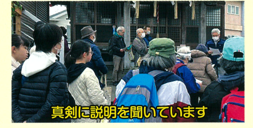
真剣に説明を聞いています