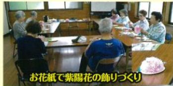
お花紙で紫陽花の飾りづくり

月に一度、皆さんとお弁当をいただき、食後はおしゃべりをしながら、季節の工作やゆめり絵、間違い探しなどで楽しんでいただいています。6月13日は高齢者の熱中症についてのお話のあと、お花紙であじさいの飾りを作りました。