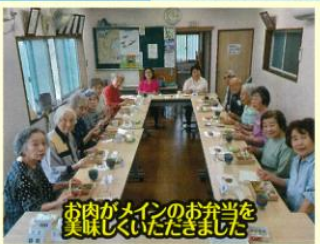
お肉がメインのお弁当を美味しくいただきました

6月はお弁当を食べたあと、「健康のためにしていること」などを話しました。金沢自然公園にハイキング、ノルディックウォーキングイベントに参加など皆さん楽しそうに話されていました。