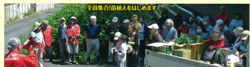
全員集合!苗植えをはじめます

5月に一般参加の皆さんと苗植えを行いました。コロナ前の収穫祭は400名程の参加者が芋掘り体験のあと氷取沢神社の境内で豚汁と芋ご飯を食べました。コロナ禍の4年間は中止1回、3回は参加を200名に制限し、2班に分け100名ずつ芋掘り体験だけをしていただきました。今年は20回目の開催です!畑の場所を変更し、芋の出来具合が楽しみです。芋掘り体験のあと神社に戻り、美味しい豚汁と芋ご飯を皆さんに味わって頂きたいと思っています。氷取沢町の星山地区の畑でお待ちしています。