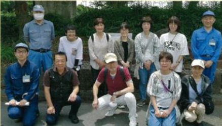
ご案内いただいた横浜市環境創造局の皆さんとっしょに

並木北にある金沢水再生センター見学では私たちの使用した水が主に微生物によりきれいになっていく仕組みを学びました。昼食後、氷取沢までのまち歩きは富岡並木ふなだまり公園の潮溜まりに癒され、地域のお店でわいわい買い物しながら楽しい時間となりました。