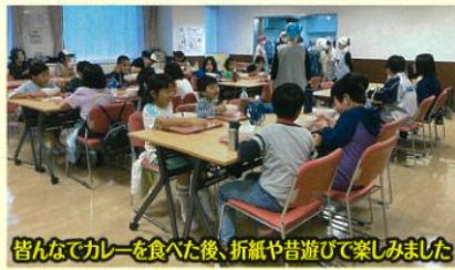
皆さんでカレーを食べた後、折紙や昔遊びで楽しみました

地域のコミュニティづくりを目指して、2017年9月から上笹下地域ケアプラザを会場に「わいわい食堂」(こども食堂)を開催し親子連れや高齢者で賑わっていましたが、コロナ禍のため一旦解散を決めました。