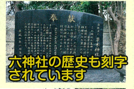
六神社の歴史も刻字されています