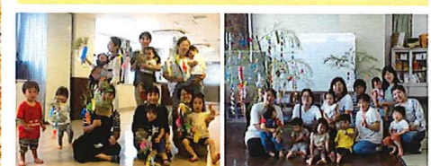
毎回10時から11時半です。ぜひ見に来てください!