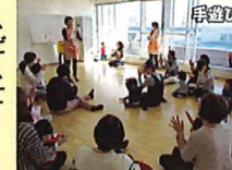
活動は運動ができる別の場所を使用

利用目的 会議に使用し、活動報告や確認、講習会などをやっています。その場で、問題点や共通認識に関する話し合いをしています。