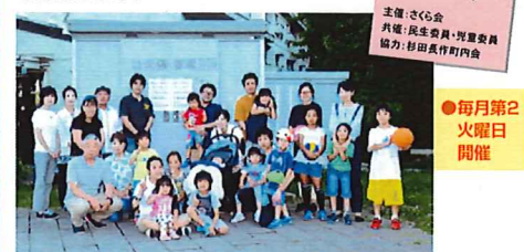
オープンを楽しみにしていると集まりました

老若男女を問わず交流、遊び、学び、息抜きの居場所として気軽に利用していただけるよう提案しています。地域で育んでいく「ほっと」できる「居場所づくり」を目指します。