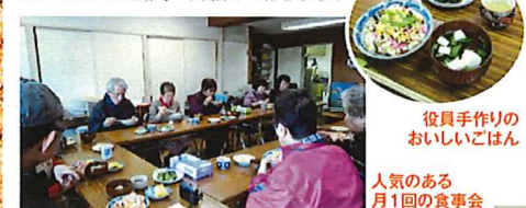
役員手作りのおいしいごはん

自治会長を中心に有志の方々や花壇整備、集会所での食事会(参加者20名位)とお茶会を月に各1回催し、他月2回出入り時間自由のサロンを開き時々カラオケや映画を楽しんでいます。お喋りの花をさかせ安否確認、情報交換の場として大切な居場所づくりをこれからも続けて行けることを役員一同願っております。