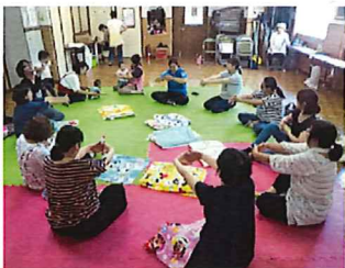
たくさんのママたちが集まります

「mamariba (ママリバ)」は、ママ達のたまり場です。岡村にお母さんの集まれる場所作りと、みんなで子育てを応援しているよ、と伝えたくて地元のおばあちゃん3人で立ち上げました。地域の町内会・行政等多くの協力で開催しています。内容は、おしゃべりや赤ちゃん遊び、お茶タイム等で、乳幼児の救急法や助産師によるお話や相談等も予定しています。かわいい赤ちゃんと遊びに来ませんか～