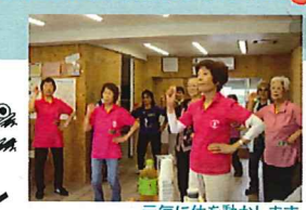
元気に体を動かします