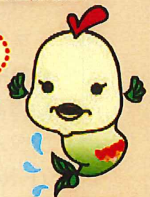
磯子区社会福祉協議会 キャラクター「ふくちゃん」

～人生100年時代到来! あと〇〇年をどう生きる!? 『ゆるく楽しい人生のヒント』