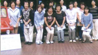
横浜市民防災センターでの体験学習