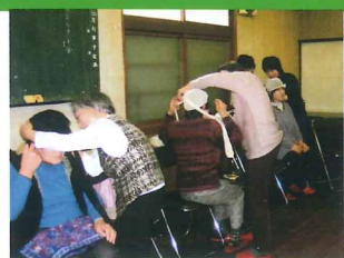
氷取沢神社社務所での講習会

日赤奉仕団は各自治町内会会長の推薦を受け人道・公平・博愛等の精神の基、現在上笹下地区では58名が活動しています。活動内容は横浜駅西口献血ルーム及び、横浜リーフ献血ルームでの奉仕・各団体催事の救護活動・赤い羽根街頭募金・救急法・救急員養成他・独自の講習会・炊き出し訓練・にこにこ(子育て支援)協力等々です。あなたも一緒に活動しましょう!!