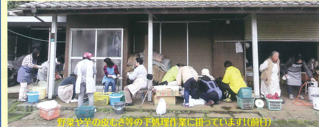
野菜や芋の皮むき等の下処理作業に掛っています!(前日)