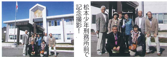
松本少年刑務所前で記念撮影!

保護司とは犯罪や非行のある少年に対し適正な処遇を行い、再び犯罪を起こさないよう改善更正する事を助ける民間のボランティアです。毎年7月に「社会を明るくする運動」を全国で行なっています。その他、保護司会では年2回ほど、刑務所、少年院など施設見学を行なっています。磯子保護司会の会員数は32名で、上笹下地区では2名不足しています。皆様方の更正保護活動にご理解ご協力賜れば幸いです。