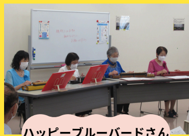
ハッピーブルーバードさん

当日は猛暑の中、25名の参加者様と6組9名の出演者様にご参加いただきました。誠にありがとうございました。