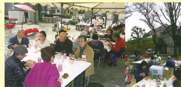
田中町内会 テーマ「住民のふれあい支えあい」毎年焼き芋大会と花見の会を開催。写真は花見の会の様子で、赤い日傘の下ではお抹茶のお点前もおこなわれ、楽しくすごせました！

磯子台パークハイツ自治会 テーマ「シニアふれあい事業の推進・拡張」 今回は初めて《歌声喫茶》風サロンを開催、淹れたての珈琲を味わい、懐かしの青春歌謡を歌いまくりました！