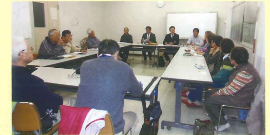
上中里団地地区自治会 テーマ「災害時要援護者支援の推進」 「人感センサー」設置に関する説明会を開催。要援護者の見守り強化！