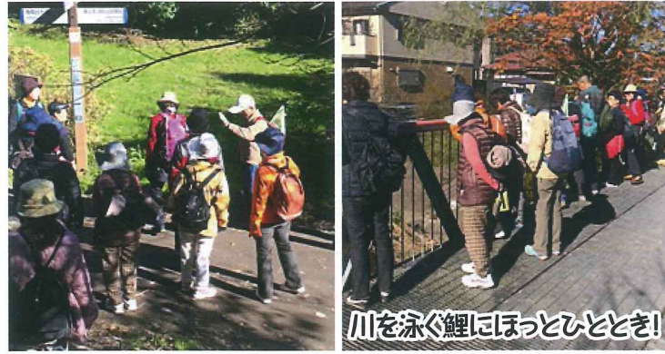
川を泳ぐ鯉にほっとひととき!

参加者17名で氷取沢神社から本郷台駅を目指しました。物知りなガイドさんの説明や途中高台からは富士山を望み、ゴール付近の川ではたくさんの鯉を愛でたりと、ゆったりペースのウォーキングとなりました。